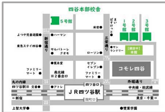
四谷本部校舎：鍼灸マッサージ科・鍼灸科