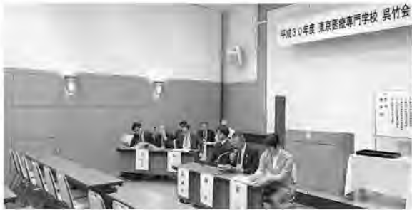
平成三十年五月二十七日(日)、主婦会館プラザエフにて