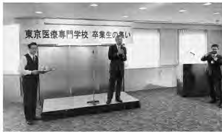
平成三十年五月二十七日(日) 十七時から四ツ谷の主婦会館で「第九回卒業生の集い」が開催された。

今年度の卒業生の集いは、平成二十八年三月に柔道整復科・鍼灸科・鍼灸マッサージ科を卒業した卒業生の実業委員会を中心に打ち合わせを行いました。