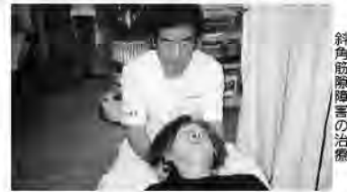
斜角筋障害の治療