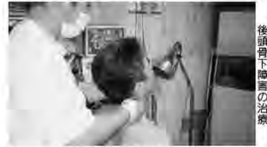
後頭骨下陥害の治療