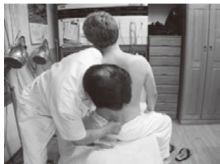
左骨盤上部左方偏位の矯正