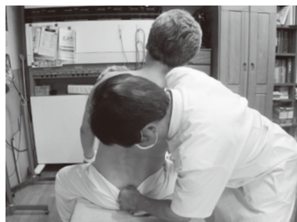
右骨盤下部偏位の矯正