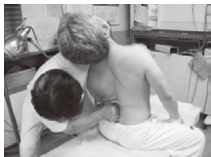
胸腰椎移行部の左側弯の矯正