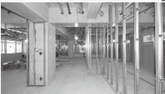
●新本館 令和5年7月時点