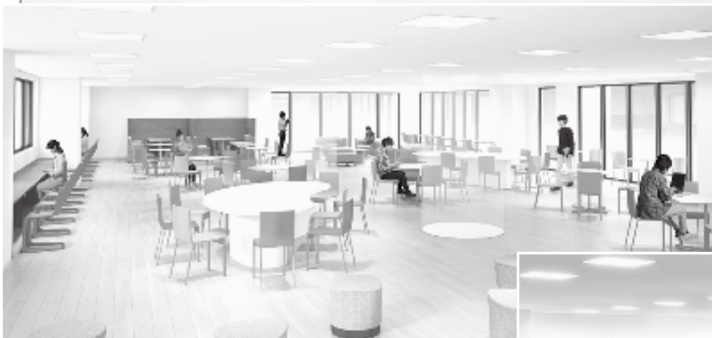
●新本館2階 学生ラウンジ 授業のあとのホッとした時間を、クラスメイトと過ごすひととき。ランチや、ティータイムは、大きな窓の外に広がる木々を眺めながら。その日の気分やグループに合った座席が配置されています。