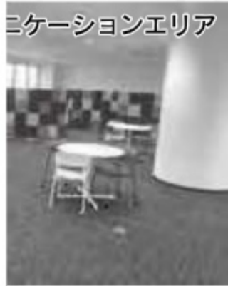
コミュニケーションエリア

コミュニケーションエリア」。日々の学 おける相談は、気軽に教員 ーションエリアですぐに先 前に配置しました。