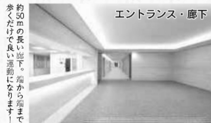
エントランス・廊下

学生一人ひとりに専用のロッカー を用意。大容量だと詰め込み過 ぎにはご注意ください。綺麗に使って ください。