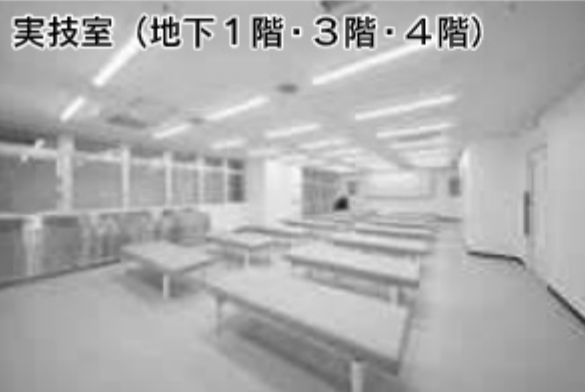
実技室 (地下1階・3階・4階)

1階の「コミュニケーション」の質問や学生生活に悩む学生を訪ねてコミュニケーションと話せるよう、教員室